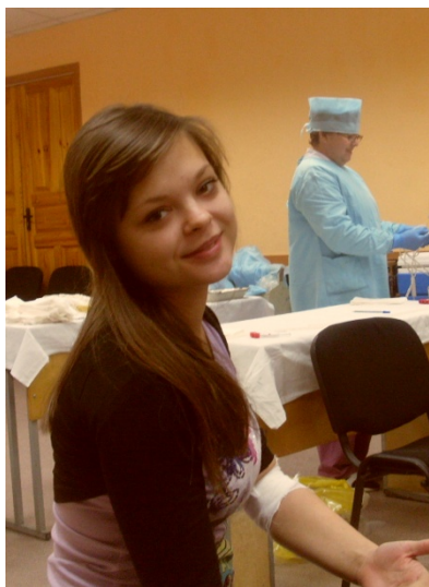
Родители будут мной гордиться!

34 × 0,465 = 15,8 литров крови сдали студенты и преподаватели техникума на Дне донора, прошедшем 1 декабря. Подавляющее большинство пришедших в актовЫй зал в этот день осуществили кроводачу впервые.