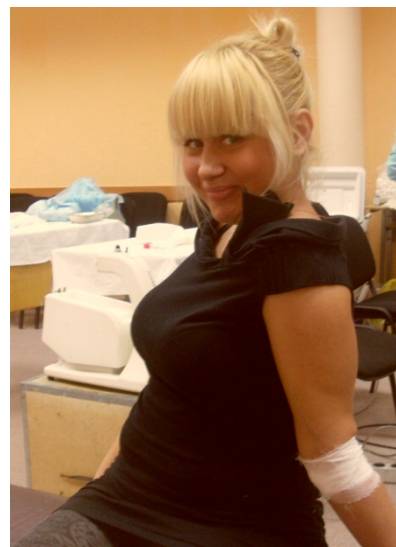
Сдать кровь может только Человек!

Как видим, никакой меркантильности нет. Те деньги, что получили доноры, ни в коей степени не являются платой за кровь. Все доноры сдавали кровь БЕЗВОЗМЕЗДНО. А те 160 руб., что они получили, всего лишь компенсация на питание.